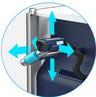
安装至自动连接系统的 MCS