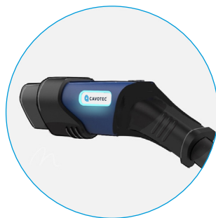
不带顶部手柄的型号