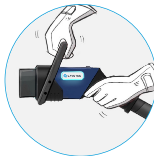
易于使用的双手柄